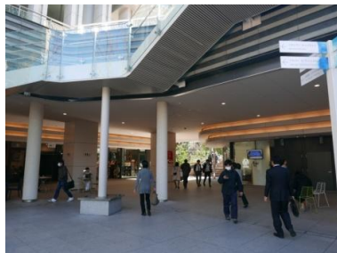
↑地下1階「ソラシティプラザ」

「聖橋方面改札」と直結している sola city（ソラシティ）の地下1階フロア「ソラシティプラザ」を進みます。中央にあるエスカレーターを横目に通り過ぎると、正面に「ファミマ!!」が見えてきます。「ファミマ!!」沿いにまっすぐ進み、ワテラスへの連絡橋を渡って頂くと「ワテラストワー オフィスコモン」に到着します。同建物内・右手奥のカフェ「Terrace8890」内を通過して、ワテラスコモンホールへお進みください。