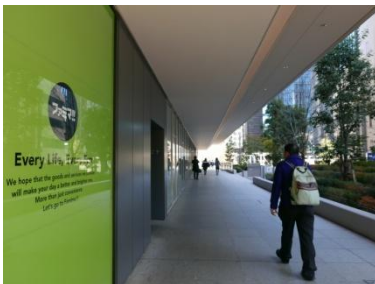
↑「ファミマ!!」沿いにお進みください