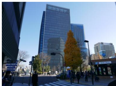
↑横断歩道を渡り「ソラシティ」前のエスカレーターを降りてください

「聖橋口」を出て、左手のソラシティ（sola city）の背の高い建物に向かって横断歩道をお渡りください。ソラシティ前にエスカレーターがございますので、地下1階フロア「ソラシティプラザ」へ降りてください。正面の「ファミマ!!」沿いにまっすぐ進み、連絡橋を渡って頂くと「ワテラストワー」に到着します。同建物内・右手奥のカフェ「Terrace8890」内を通過して、ワテラスコモンホールへお進みください。